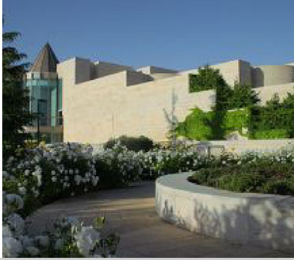
האשמות חמורות. בימ"ש העליון